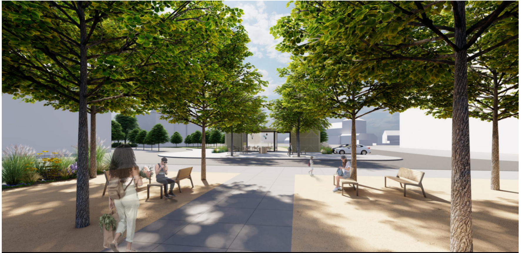
vizualizace nového lokálního centra